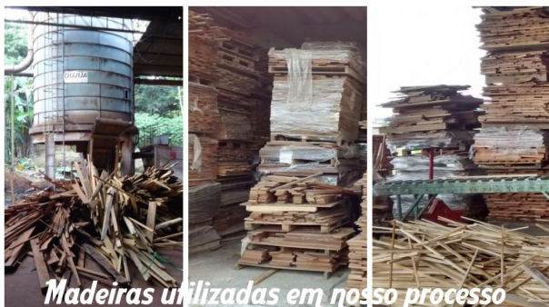
Material utilizado na produção