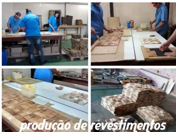
Produção de revestimentos a base de resíduos