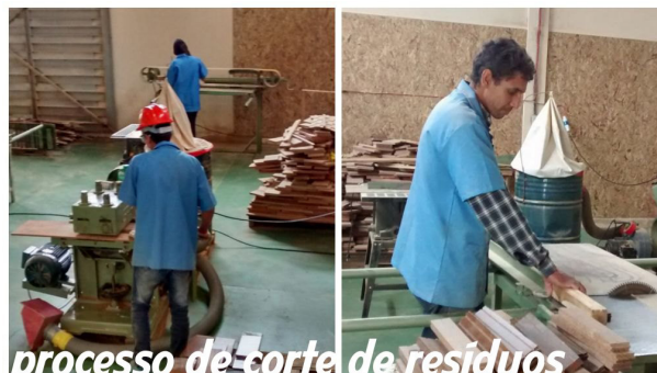
Processo de produção