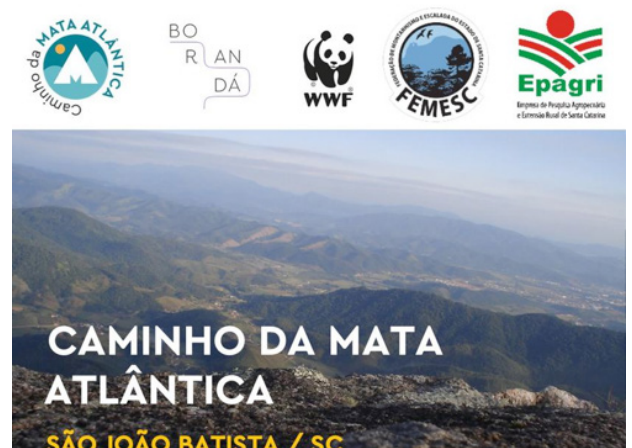
Convite São João Batista