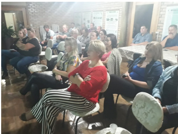
Reunião São Bonifácio