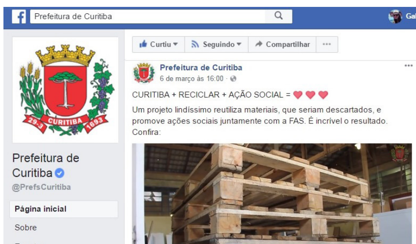
Vídeo Móveis Pallets - Facebook Prefeitura de Curitiba