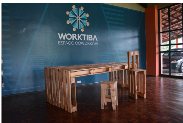
Móveis Pallets Worktiba