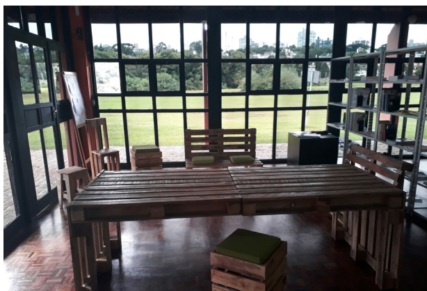
Móveis Pallets Worktiba