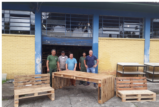
Móveis Pallets Equipe FAS