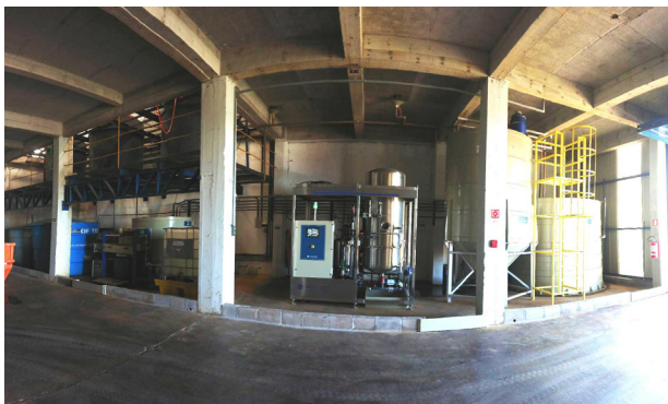
Foto do processo