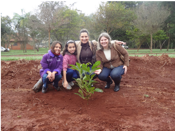
Plantio na mata sao francisco