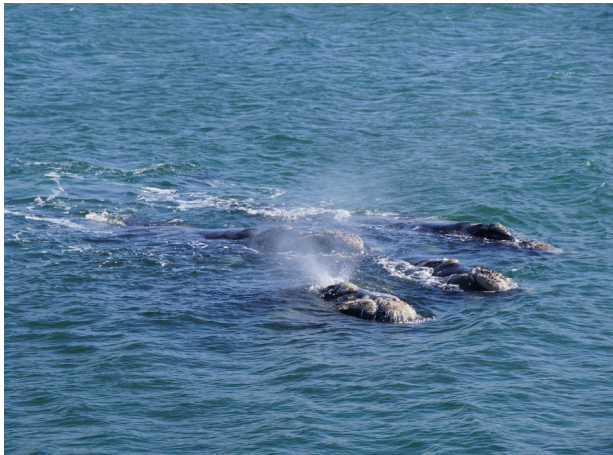
Três baleias nas proximidades do Porto