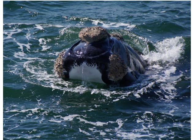
Vista da cabeça com suas calosidades