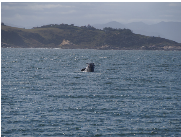
Baleia na Praia do Porto