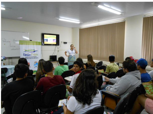
Trabalho de sensibilização e educação ambiental do Nossa Praia foi apresentado para mais de 2 mil pessoas desde o início do ano