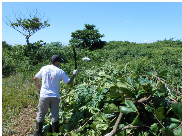
Espécies invasoras da restinga sendo retiradas no projeto Nossa Praia