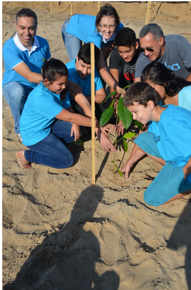
Integrantes do Rotary e do Interact Club participam de plantio de nativas