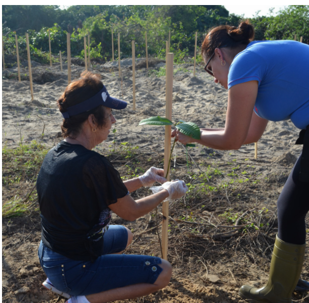
População participou do evento que marcou o início da recomposição vegetal da restinga