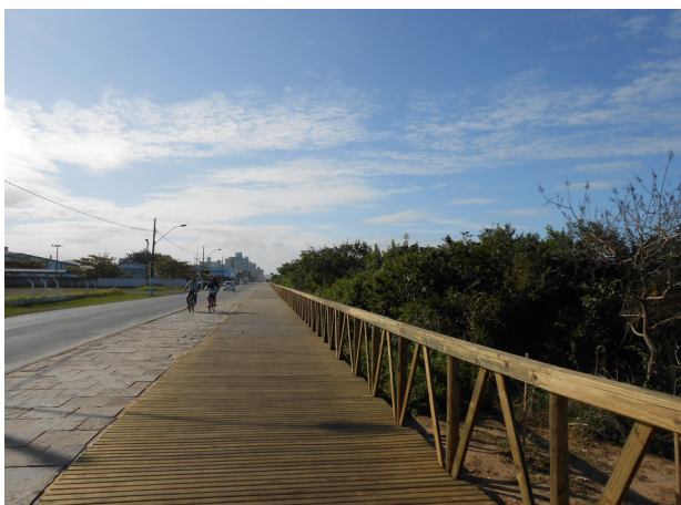
Trecho do deque de madeira que está substituindo a passarela de ardósia