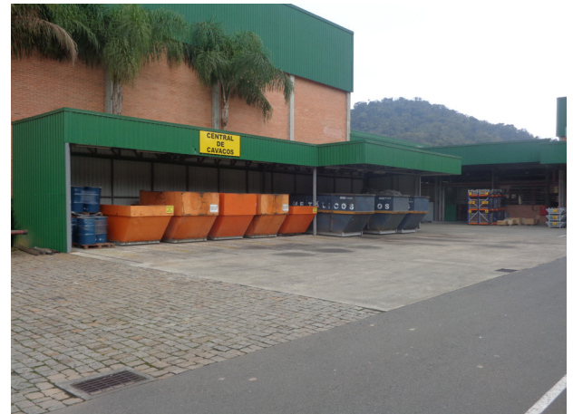
Central de Cavacos