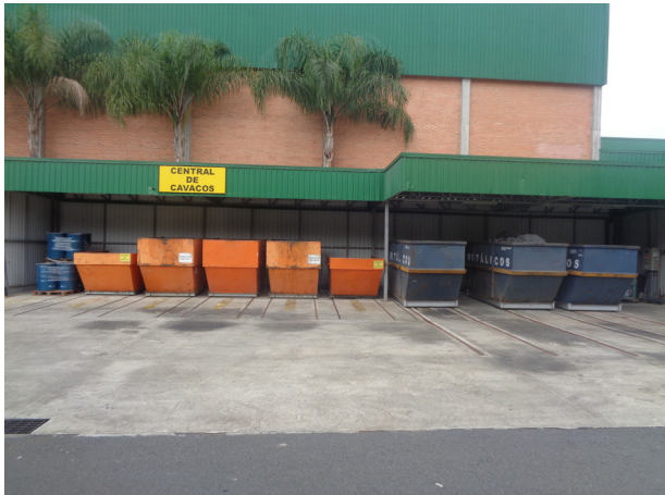
Central de Cavacos