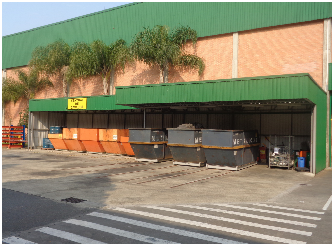
Central de Cavacos