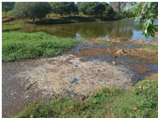
Situação problema encontrada antes da implantação do projeto: chorume atingindo um curso d'água na Microbacia Barra Mansa