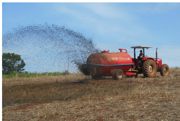
Chorume sendo distribuído adequadamente em área de lavoura