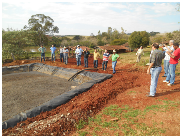
Uma das propriedades beneficiadas recebendo uma excursão de técnicos