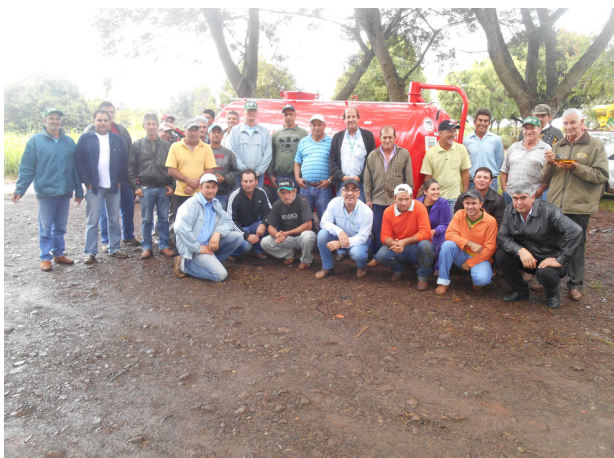
Evento de entrega do distribuidor de esterco líquido para a Associação de Produtores Rurais da Barra Mansa