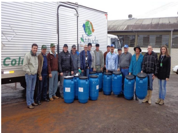
Programa Coleta Segura: recolhimento de bombonas na comunidade