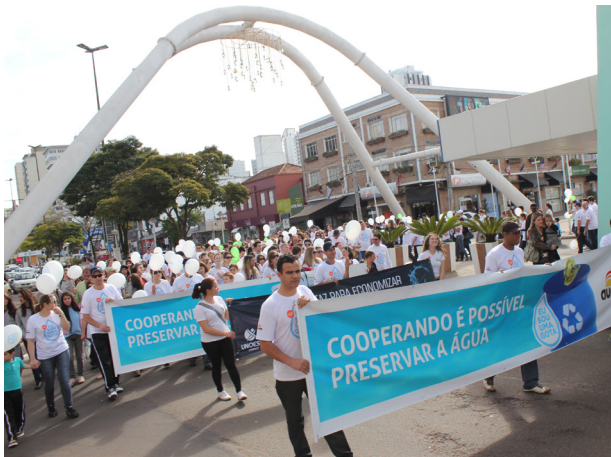
Caminhada em alusão a Campanha Eu Sou uma Gota