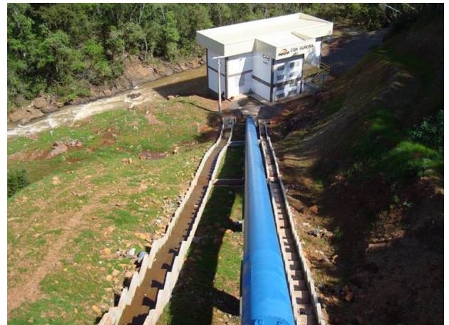
Central Geradora de Energia - Chapecó