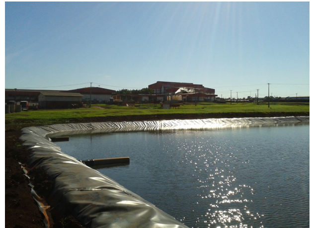
Estação de Tratamento de Efluentes