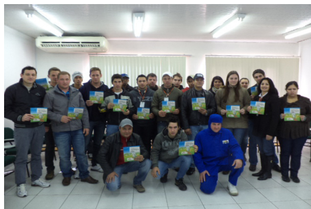
Capacitação do Programa Reciclagem Vida